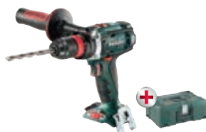
Akku-Bohrschrauber BS 18 LTX Quick Bestell-Nr. 602193840