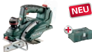
Akku-Hobel HO 18 LTX 20-82 Bestell-Nr. 602082840