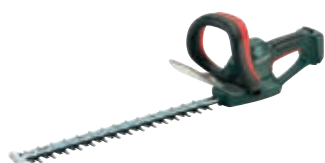
Akku-Heckenschere AHS 18-55 V Bestell-Nr. 600463850