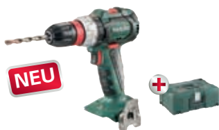
Akku-Bohrschrauber BS 18 LT BL Q (Brushless-Motor) Bestell-Nr. 602334840