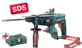
Akku-Kombihammer KHA 18 LTX Bestell-Nr. 600210840