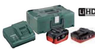
Basis-Set 1 x LiHD 5.5 & 1 x 3.5 Ah 1 x Ladegerät ASC 30-36 V Bestell-Nr. 685103000

Maschinen ohne Akku (Karkasse) + Basis-Sets jedes der abgebildeten Produkte für nur