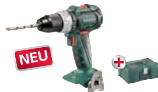
Akku-Schlagbohrmaschine SB 18 LT BL (Brushless-Motor) Bestell-Nr. 602316840