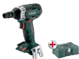
Akku-Schlagschrauber SSW 18 LTX 200 Bestell-Nr. 602195840