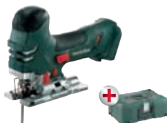
Akku-Stichsäge STA 18 LTX 140 Bestell-Nr. 601405840