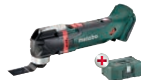
Akku-Multitool MT 18 LTX Bestell-Nr. 613021840