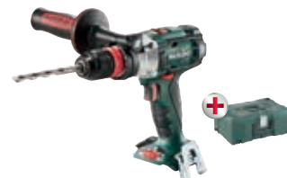
Akku-Schlagbohrmaschine SB 18 LTX Quick Bestell-Nr. 602200840