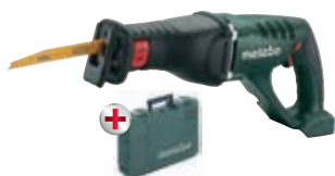
Akku-Säbelsäge ASE 18 LTX Bestell-Nr. 690815000