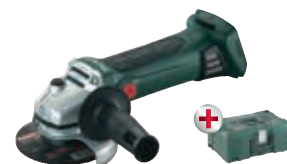
Akku-Winkelschleifer W 18 LTX 125 Quick Bestell-Nr. 602174840