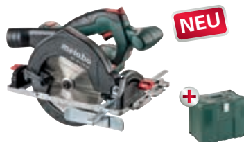
Akku-Handkreissäge KS 18 LTX 57 Bestell-Nr. 601857840