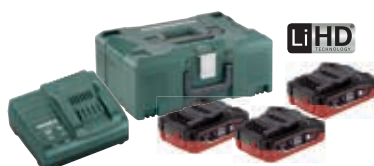
Basis-Set 3 x LiHD 3.5 Ah 1 x Ladegerät ASC 30-36 V Bestell-Nr. 685100000